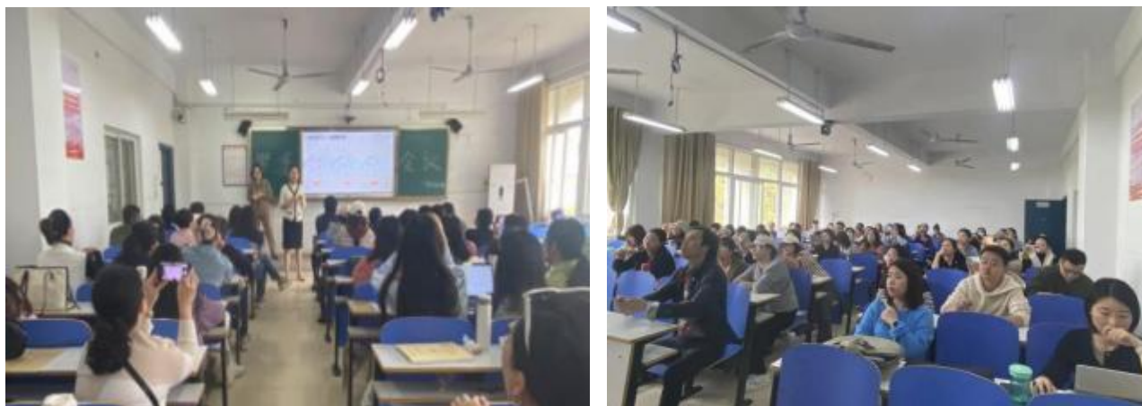
(1) 2023年10月11日开展本专业毕业设计指导老师分配工作